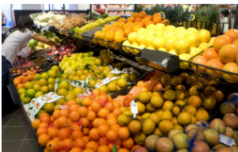
Hoofddorp - Fruits bij een vestiging van Albert Heijn in Hoofddorp.